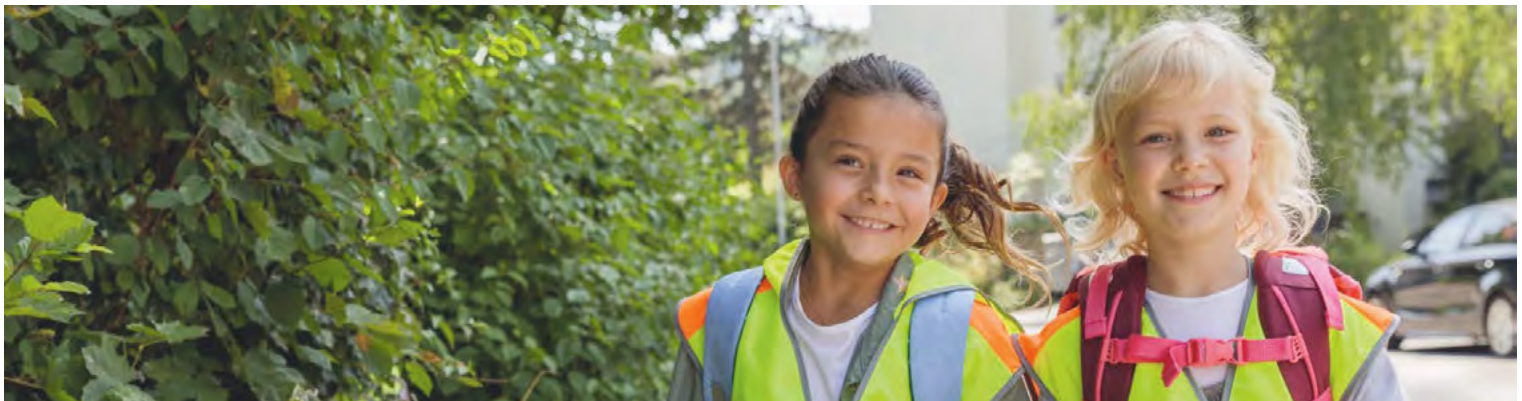
Sichtbarkeit auf dem Schulweg ist wichtig, ebenso, dass das Kind den Weg vor dem Schulbeginn übt.